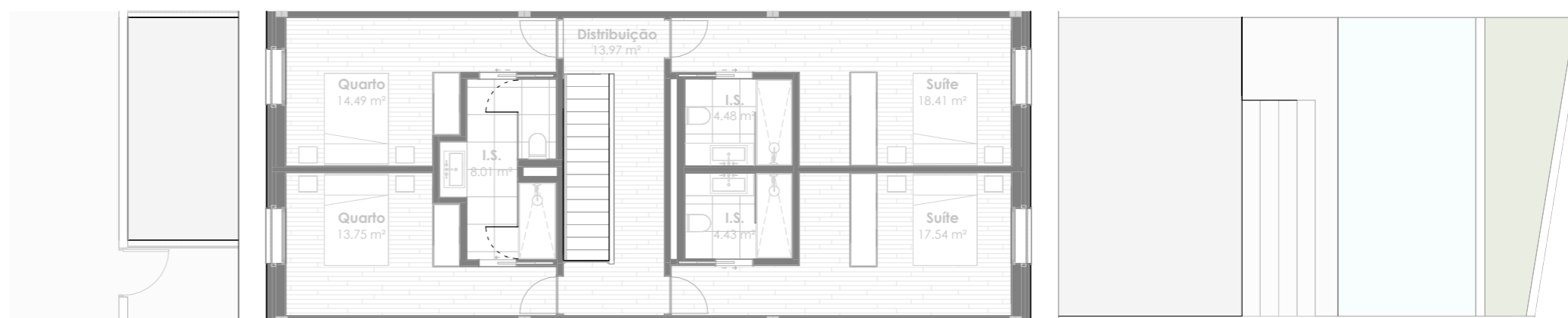
Planta do piso 2