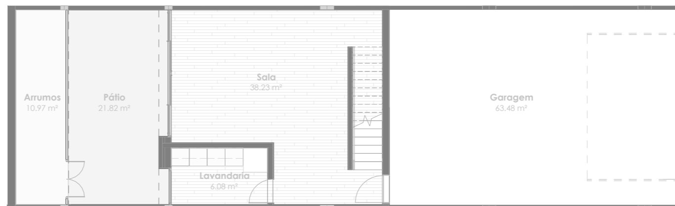
Planta do piso -1