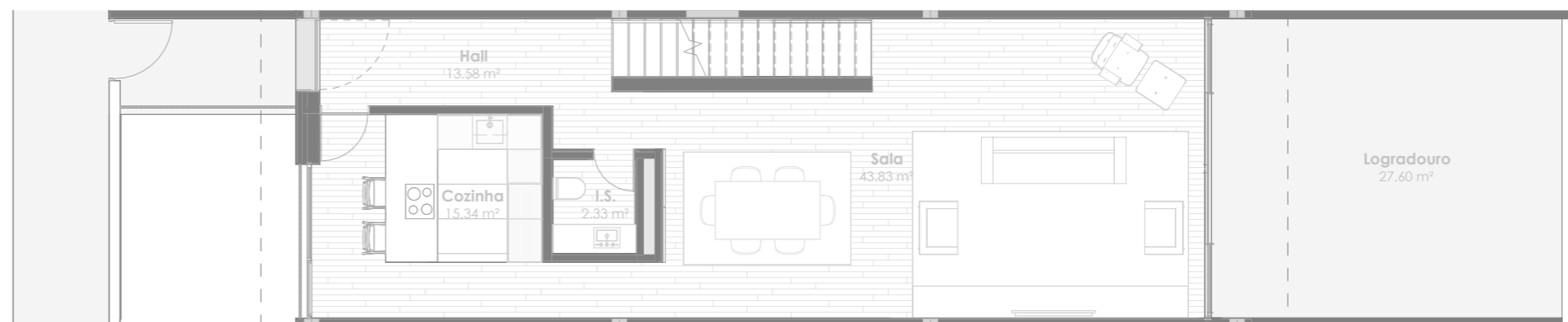
Planta do Piso 1