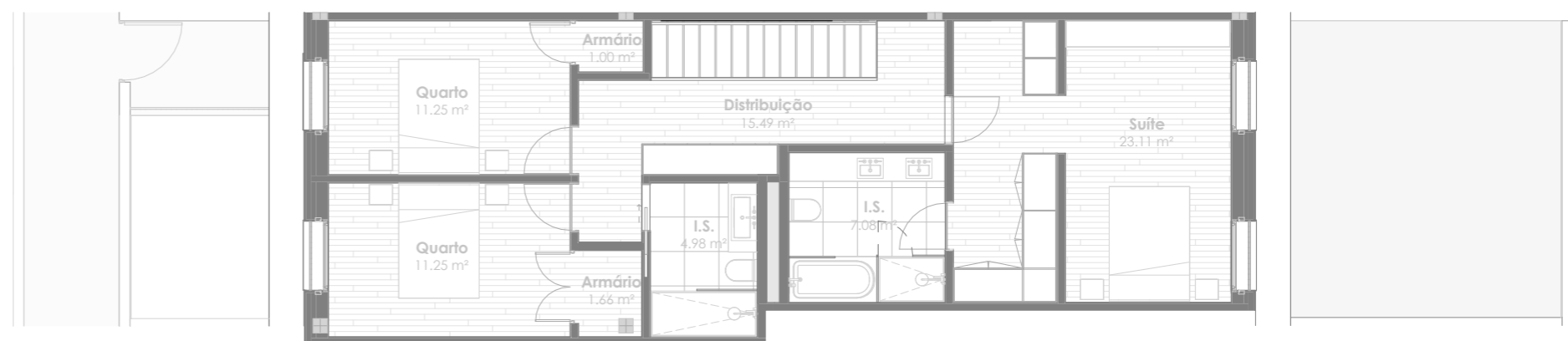
Planta do Piso 2