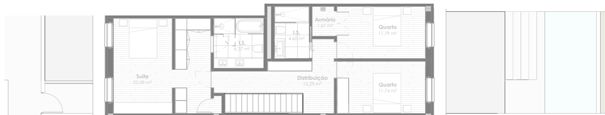
Planta do Piso 2