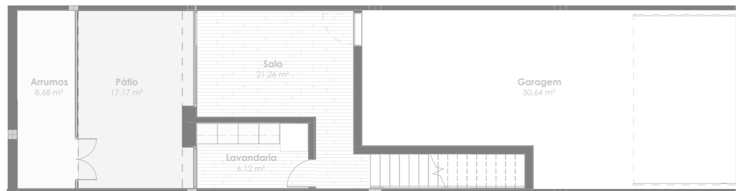
Planta do Piso -1