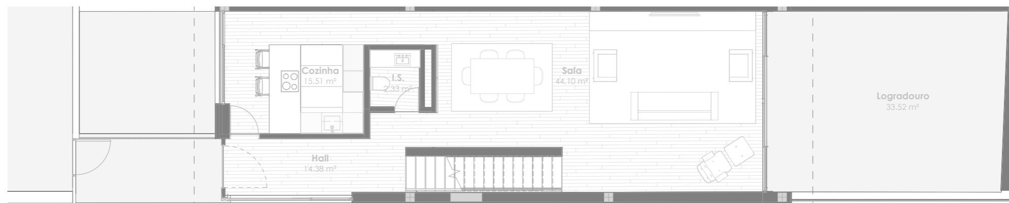
Planta do Piso 1