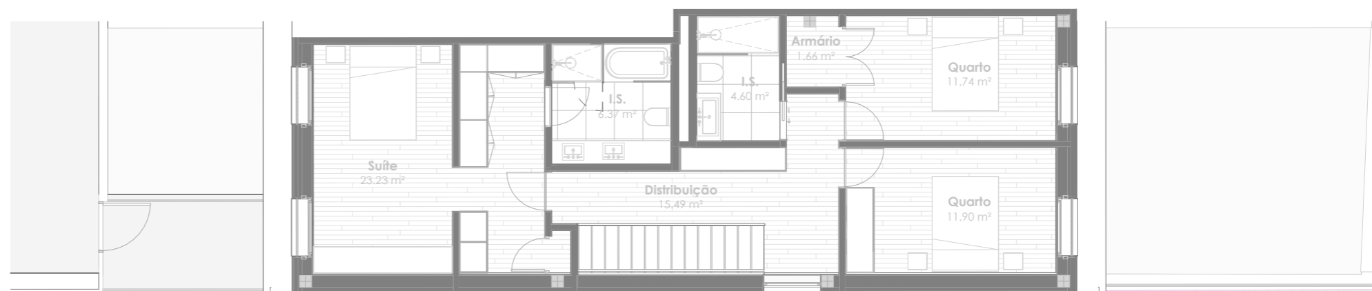
Planta do Piso 2