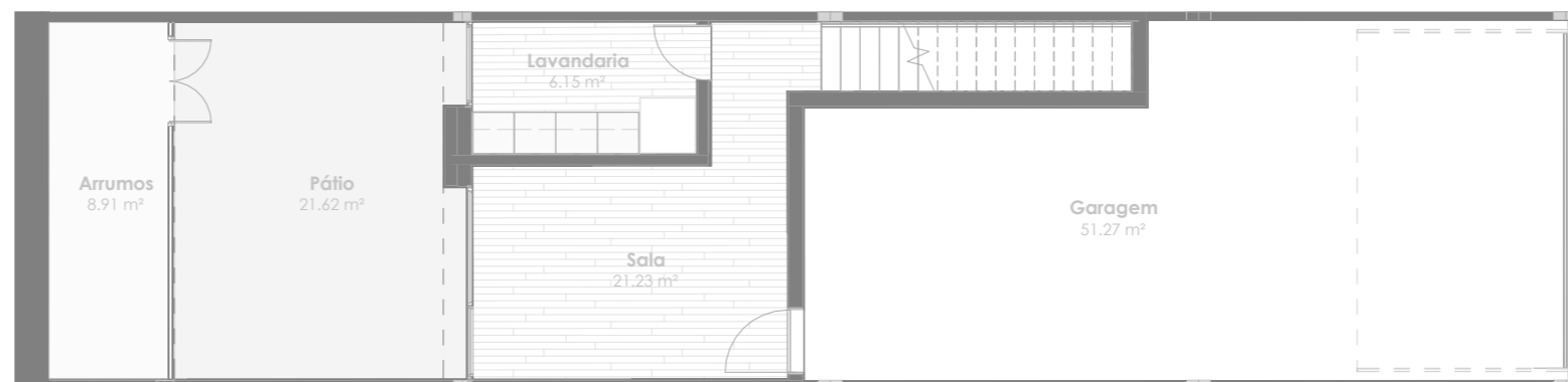
Planta do Piso -1