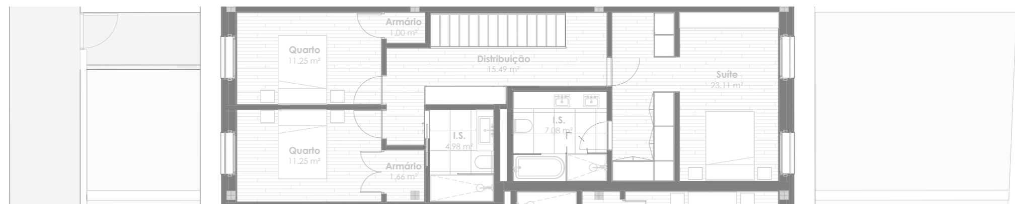
Planta do Piso 2