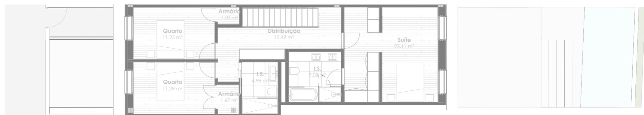
Planta do Piso 2