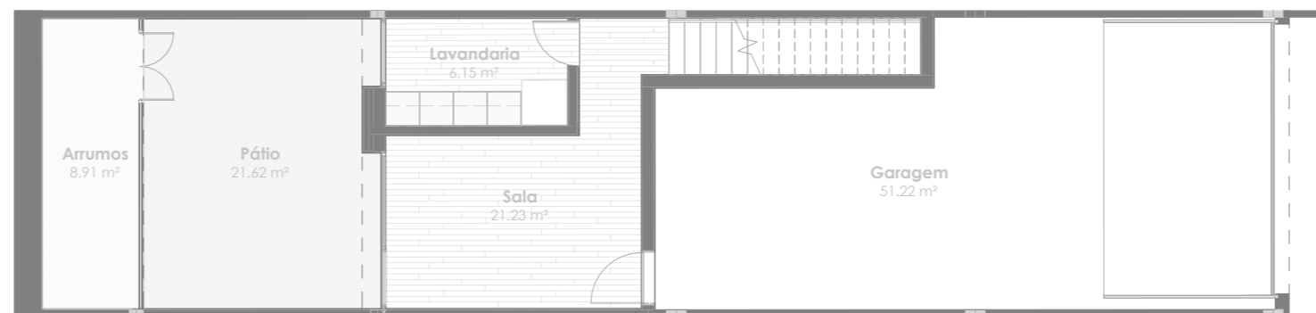
Planta do Piso -1