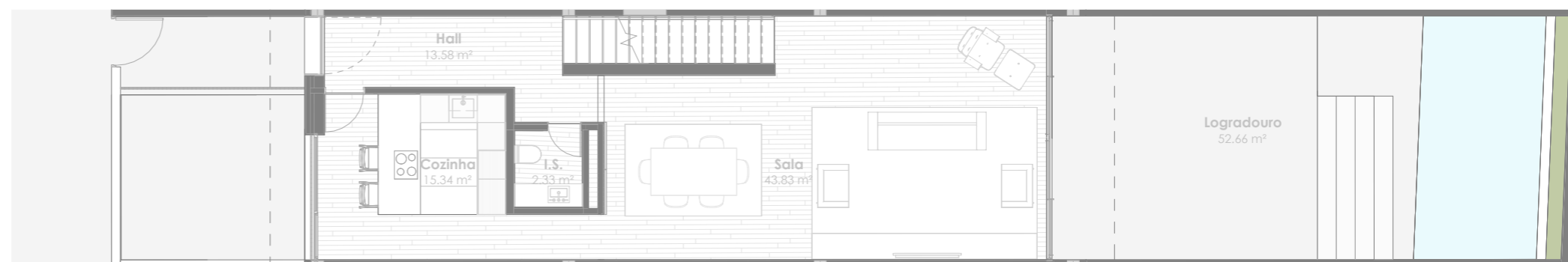
Planta do Piso 1