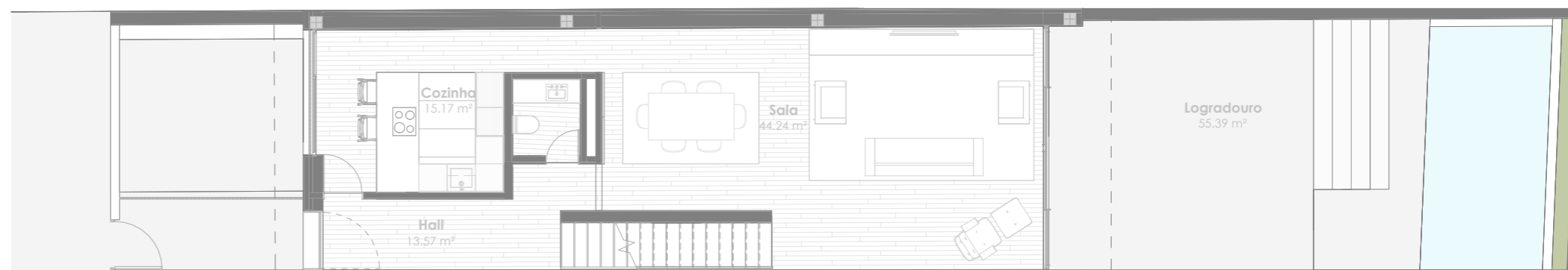
Planta do Piso 1