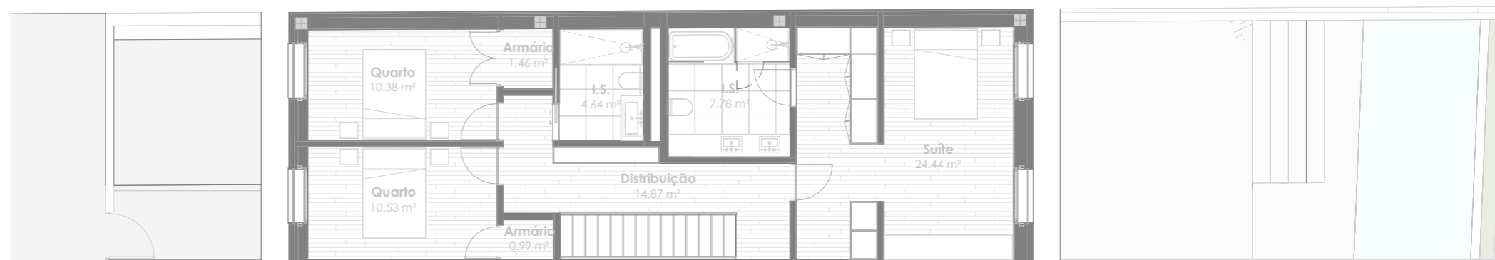
Planta do Piso 2