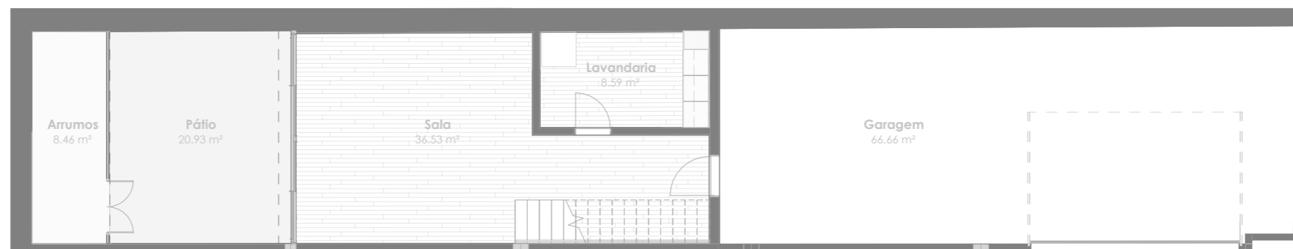
Planta do Piso -1